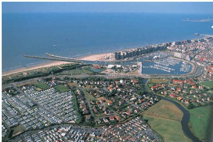
Blankenberge / B